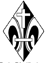
Freie Pfadfinder Stamm „Gralstritter“